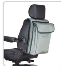
Sac dorsal Tasche