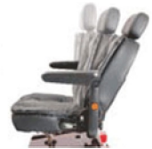
Réglages du siège Sitzverstellung