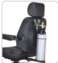
Support bouteille oxygène Halterung für Sauerstoffflasche