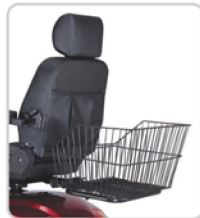
Corbeille arrière Zusatzkorb hinten